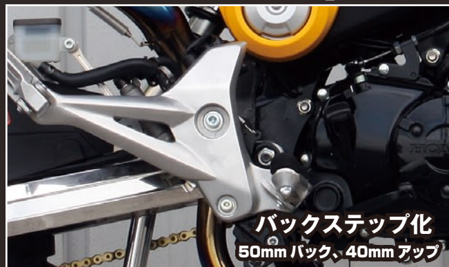
バックステップ化 50mmバック、40mmアップ