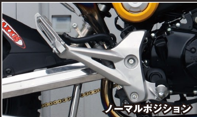
ノーマルポジション